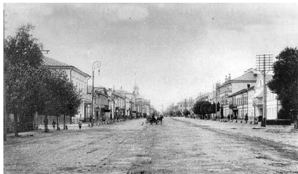
Тверь, улица Миллионная (сейчас Советская)