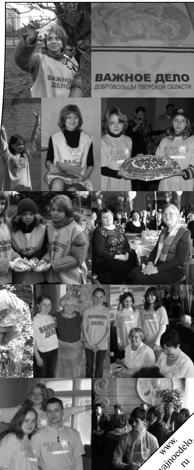
ВАЖНОЕ ДЕЛО ДОБРОВОЛЬЦЫ ТВЕРСКОЙ ОБЛАСТИ